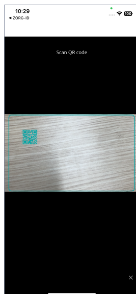
Figuur 5: Scan QR Code

Bij bepaalde documentgeneraties is de BSN-code alleen beschikbaar op de achterkant van uw WID-document. De app zal dan vragen om ook de achterkant van het document te scannen (Scan QR code).