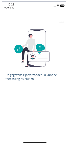
Figuur 6: Gegevens verstuurd